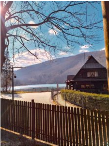
Krzywa Chata z widokiem na Jezioro Zaporowe

Przejście zajmuje około 1,5–2 godzin. Szlak jest umiarkowanie trudny z przewyższeniem około 600 metrów. Ze Szyndzielni można kontynuować dalszą drogę czerwonym szlakiem na Klimczok (1117 m n.p.m.), co dodatkowo zajmuje około 30–40 minut marszu (ok. 2 km, przewyższenie ok. 100 m).